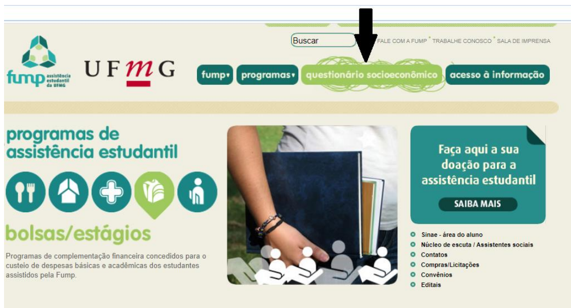
Tela da página da FUMP

Comunidade externa: no período de 24/01 a 30/01 realizar o estudo socioeconômico na Fundação Mendes Pimentel (FUMP/UFMG) preenchendo o "Questionário socioeconômico" no site http://www.fump.ufmg.br/